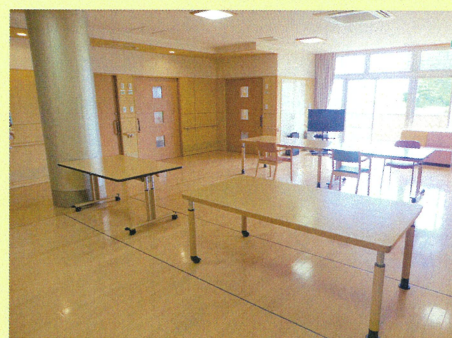
ユニットフロアー